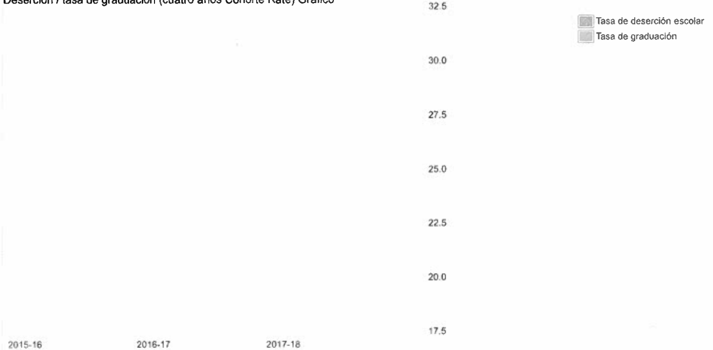
Deserción / tasa de graduación (cuatro años Cohorte Rate) Gráfico

Para la fórmula para calcular el índice de graduación de cohorte 2016-17 y 2017-18 ajustado, ver el documento 2018-19 datos Definiciones de elementos se encuentra en la página web del SARC en https://www.cde.ca.gov/ta/ac/SA/ .